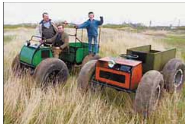
Един в двух лицах

Як бачимо, автори закону «Про податок з власників транспортних засобів» все ж передбачили зниження на 50% транспортного податку для власників легкових автомобілів з об'ємом двигуна до 2500 см куб., зареєстрованих в Україні до 1990 року включно, і на вантажівки з об'ємом циліндрів до 6001 см куб., тих же років випуску. Утім, з 1990-го минуло вже 18 років. І для автомобіля (особливо, вітчизняного) це зовсім немало. Адаже навіть десятирічне авто розкішно ніяк не назвеш. Сподіватимемося, народні обранці це усвідомлюють, тож приймуть відповідні поправки до закону.