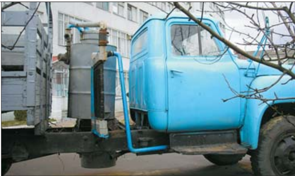
Майбутнє України на радянській базі

У 1957 р. виробництво газогенераторів припинилося і в СРСР, де на додачу до каспійських родовищ нафти освоювалися і поволзькі. СРСР став добувати понад 600 млн. тонн нафти на рік, при-