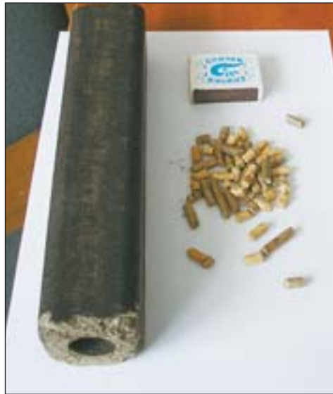
Брикети і пілети для газогенераторного двигуна

тому що для народного господарства було потрібно лише 65 млн. тонн бензину.