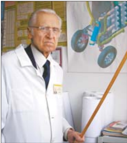
Професор Леонід Лось