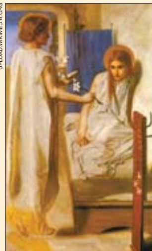
«Благовіщення», Данте Габріель Россетті, 1850 р.

Близько 375 року за наказом короля дунайських готів Унгеріха було підпалено храм, у якому йшло богослужіння. У полум'ї загинули 308 чоловік. Дружина короля сусіднього готського племені християнка Алла, дізнавшись про це, прибула на місце пожежі, аби зібрати останки мучеників. Їх вона переправила зі своєю дочкою Дуклідією до «країни Сирської» (так, найімовірніше, називалася одна з областей на території теперішньої Румунії). А саму