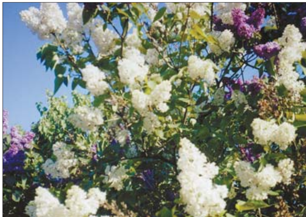
Дерево одне, а квіти різні

Пропоную вашій увазі спосіб щеплення дерев, прості і надійні. Все, що я описую, засноване на праці декількох поколінь.