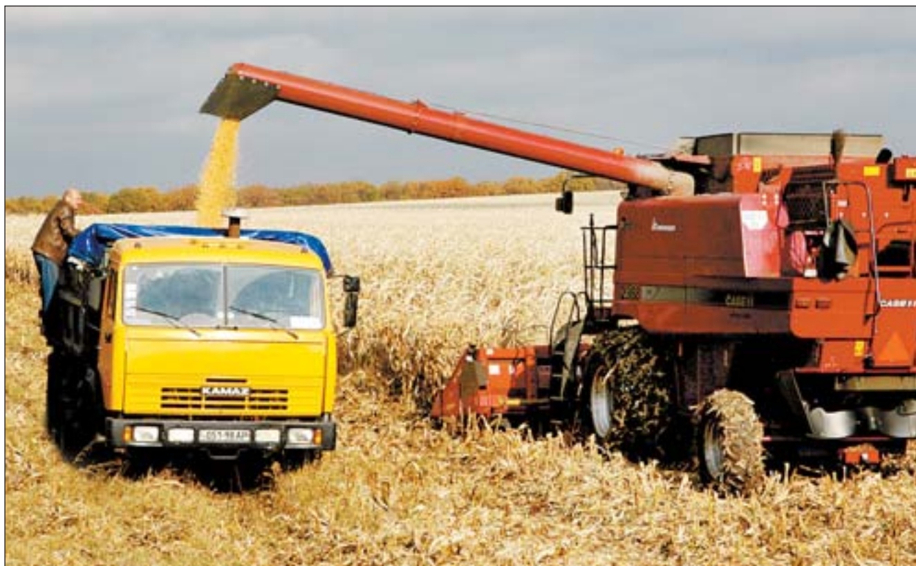
Збір кукурудзи в господарстві «Вікторія» Білокуракинського району Луганської області