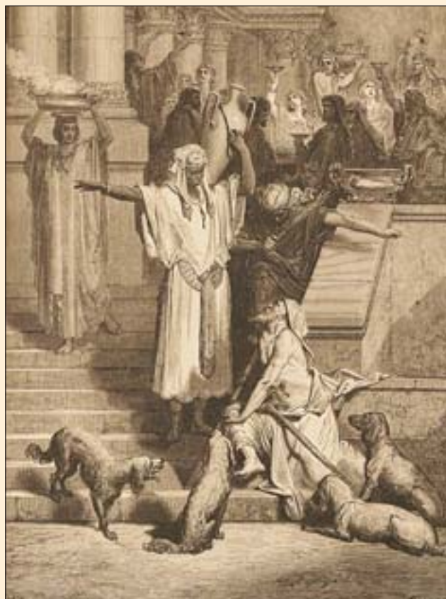
Гюстав Доре. Багатій і Лазар