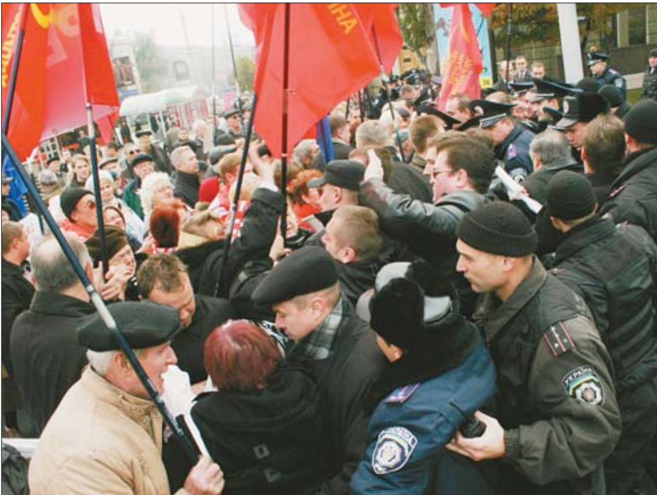
29 жовтня під час робочого візиту Віктора Ющенка на Донеччину прибічники Компартії України вийшли в Донецьку на мітинг під гаслами «Ющенко, не лезь в НАТО!», «Долой пост президента!», «Ющенко — предатель интересов Украины», «Нет национал-фашизму в Украине!» Співробітники правоохоронних органів не пропустили мітингувальників до будівлі Донецької ОДА.