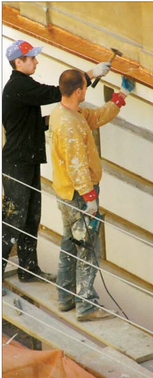
Українські заробітчани виборюють місце під «трудоим сонцем»