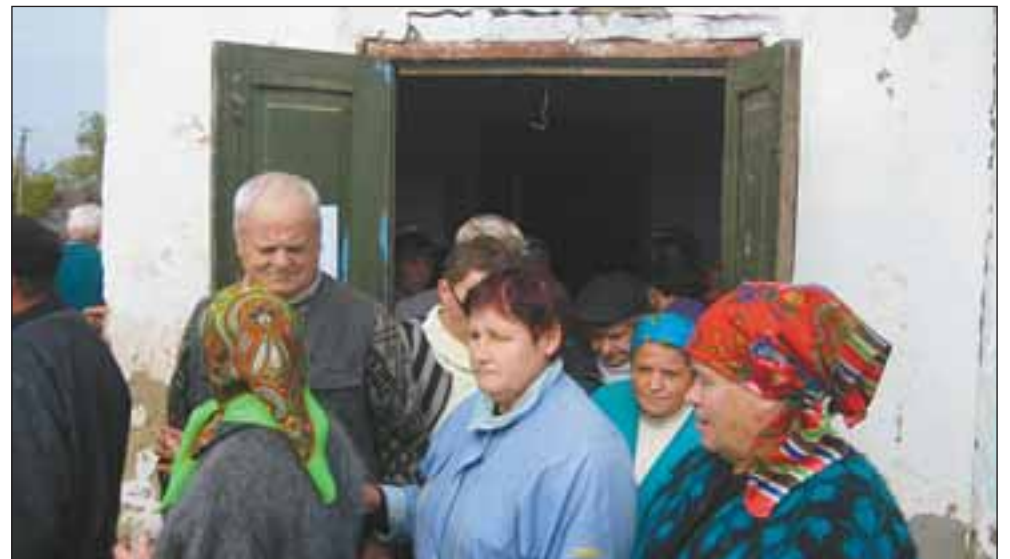
Спонтанелічені селяни розходилися без явного оптимізму