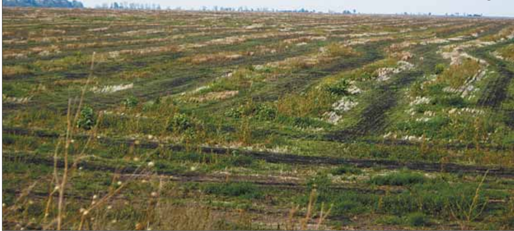
Орні землі — причина конфлікту в Кошарах

ком злизала. І тепер селянам доводиться їздити по непрохідній після дощів ґрунтової колії, накатаній на узбіччі «зачищеної» дороги. Це штучне пошкодження шляху неабияк ускладнило доставку в Кошари привозних товарів і доступ закупників зерна та іншої сільгосппродукції.