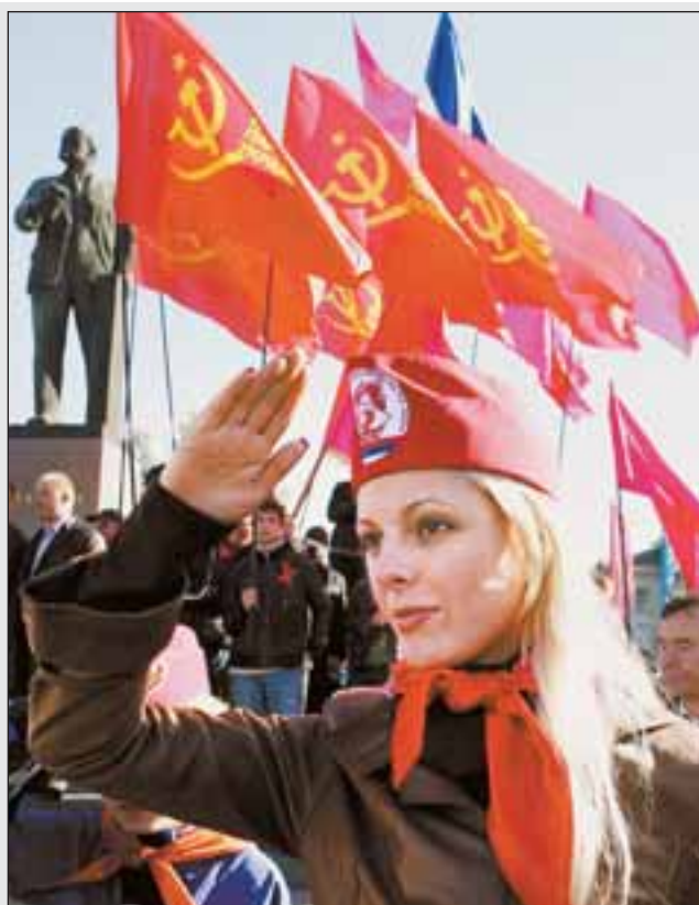
У Сімферополі відбулися заходи, присвячені 91 річниці Жовтневої революції

Анатолій ПАНАСЕВИЧ, Володимир-Волинський