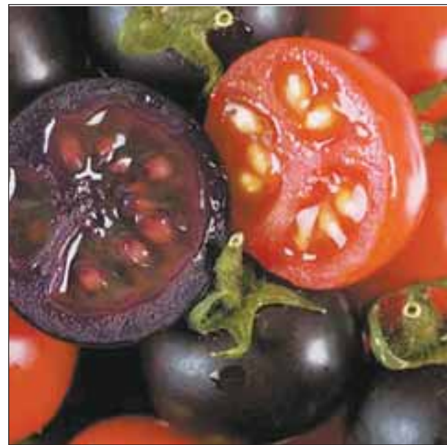
Томати, виведені британськими генетиками, допоможуть при лікуванні онкозахворювань

Що ж, поки вчені не дійшли однозначного висновку з приводу цієї речовини, рекомендуємо віддавати перевагу вітчизняним виробникам.