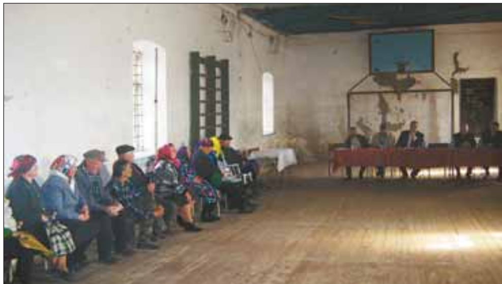
Зустріч в. о. глави райдержадміністрації з частиною жителів Кошар пройшла в аварійному спортзалі