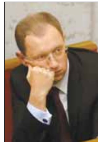
Пожалуйста, см. начало на стр. 1