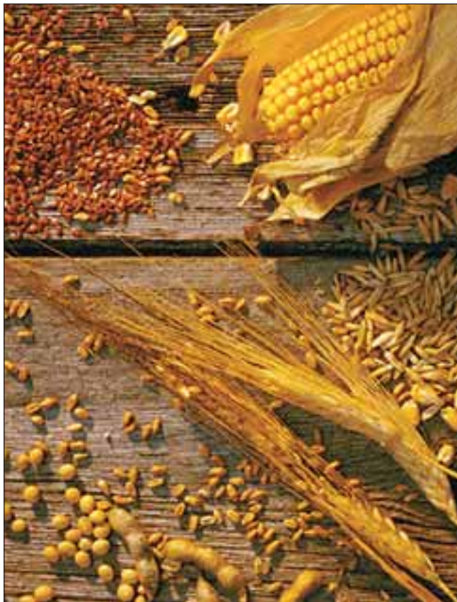
Продукты генной инженерии

Внедрение ГМ-культур, способных противостоять влиянию как старых, так и вновь разработанных химикатов, с одной стороны, позволяет увеличивать урожайность, с другой же — ставит сельхозпроизводителя в зависимость от поставщика, который, наряду с предложением ГМ-семян, навязывает клиенту соответствующий гербицид. Ясное дело, производитель ГМ-семян вырабатывает устойчивость растений лишь к тем веществам, которые сам и производит. В результате фирмы-производители ГМО и соответствующих им гербицидов утверждают на них свои лицензионные права и становятся глобальными монополистами на рынке производства продовольственных и технических культур.