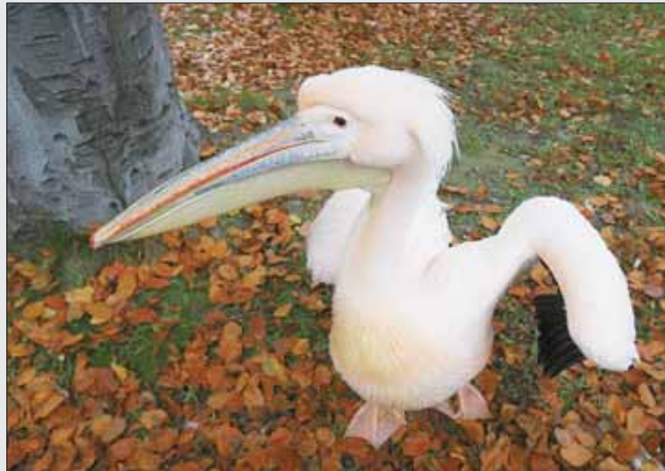
Пелікан рожевий у Київському зоопарку

Пелікани надають перевагу прісноводним водоймищам, цікаво, що, навіть, у негніздовий період вони тримаються парами. Харчуються рибою, плаваючи по поверхні водоймища, періодично опускаючи голову у воду й черпаючи здобич дзьобом. Особливо результативні колективні полювання, коли птахи, вишикувавшись півколом, лясаючи крилами й шумлячи, заганяють рибу на мілководдя.