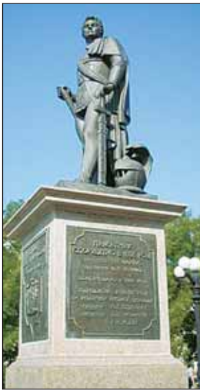
Памятник князю Потемкину Таврическому

Херсон. «Известны вам предположения Наши о заведении для Черного моря гавани и верфи...» — этими словами начинается указ императрицы Екатерины II от 18 июня 1778 г. об основании нового города, имя которому Херсон. Любили тогда при дворе все греческое, вот и назвали населенный пункт в подражание Херсонесу, древнеэллинической колонии в Крыму. Вышел небольшой курьез: «херсонес» переводится с древнегреческого как «полуостров», а в Херсоне такового нет и не было. Впрочем, на судьбе города ошибка не сказалась. Одних только знаменитых людей в нем перебивало без числа: Григорий Потемкин, Александр Суворов, Федор Ушаков, Осип Дерибас и др. Как и XVIII в., в Херсоне продолжают строить океанские корабли. Поэтому не уди-