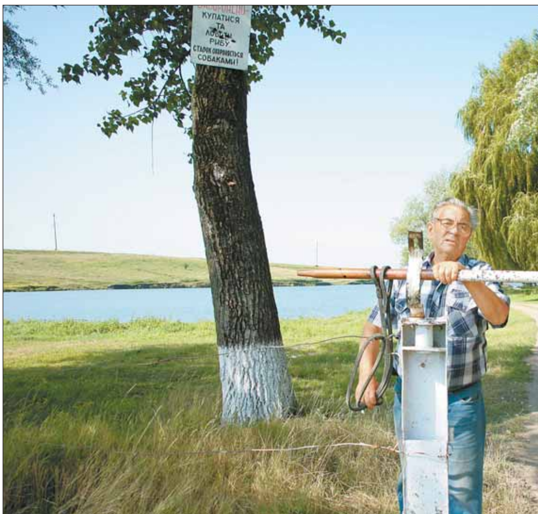
«Начальник пруда», где издевались над рыбаками, грозился разбить журналисту фотоаппарат

Оговорюсь сразу: ни одно из должностных лиц района не горело желанием с нами встречаться. Как только по телефону их секретарши выясняли, из-за чего к ним «ідуть з газети», сразу начинались «совещания», «отпуска» и т. д. Знакомая картина.