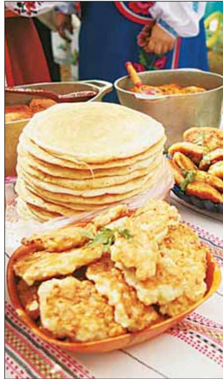
Каждая хозяйка города знает не менее 25 рецептов дерунов