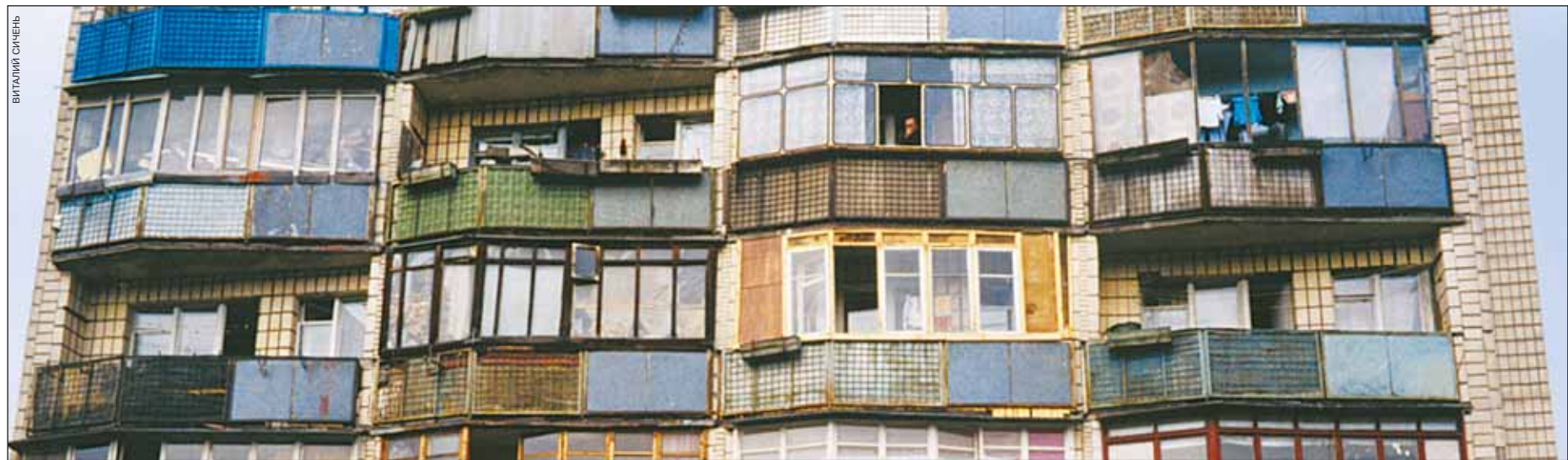
Здесь живем мы