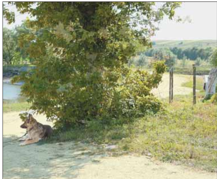
Колючая проволока и овчарки у пруда — привычный «пейзаж» в Заставне

Человек в погонах разве что не оттолкнул, а так — невозмутимо стремительно прошел мимо, не реагируя ни