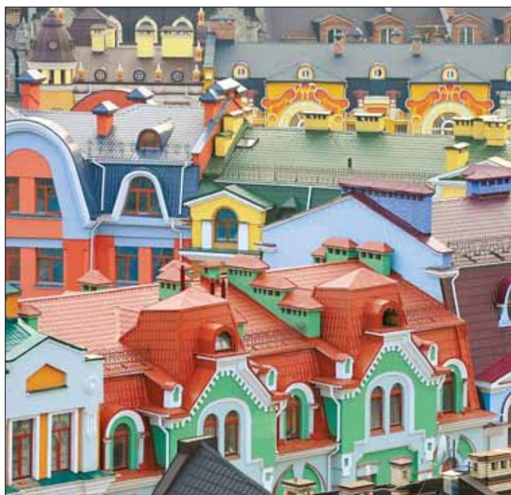
Здесь живут «хозяева жизни»