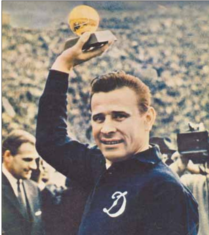
1963 г. Лев Яшин с призом «Золотой мяч»

— И, наверное, окончательно добила футбольных бюрократов, ре-