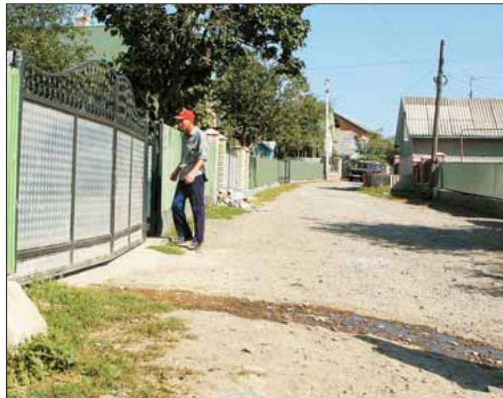
Улица враз становилась пустынной, как только народ понимал, зачем приехали журналисты