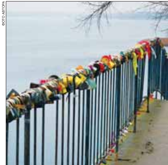
Замки от влюбленных на ограждении дамбы Каховской ГЭС