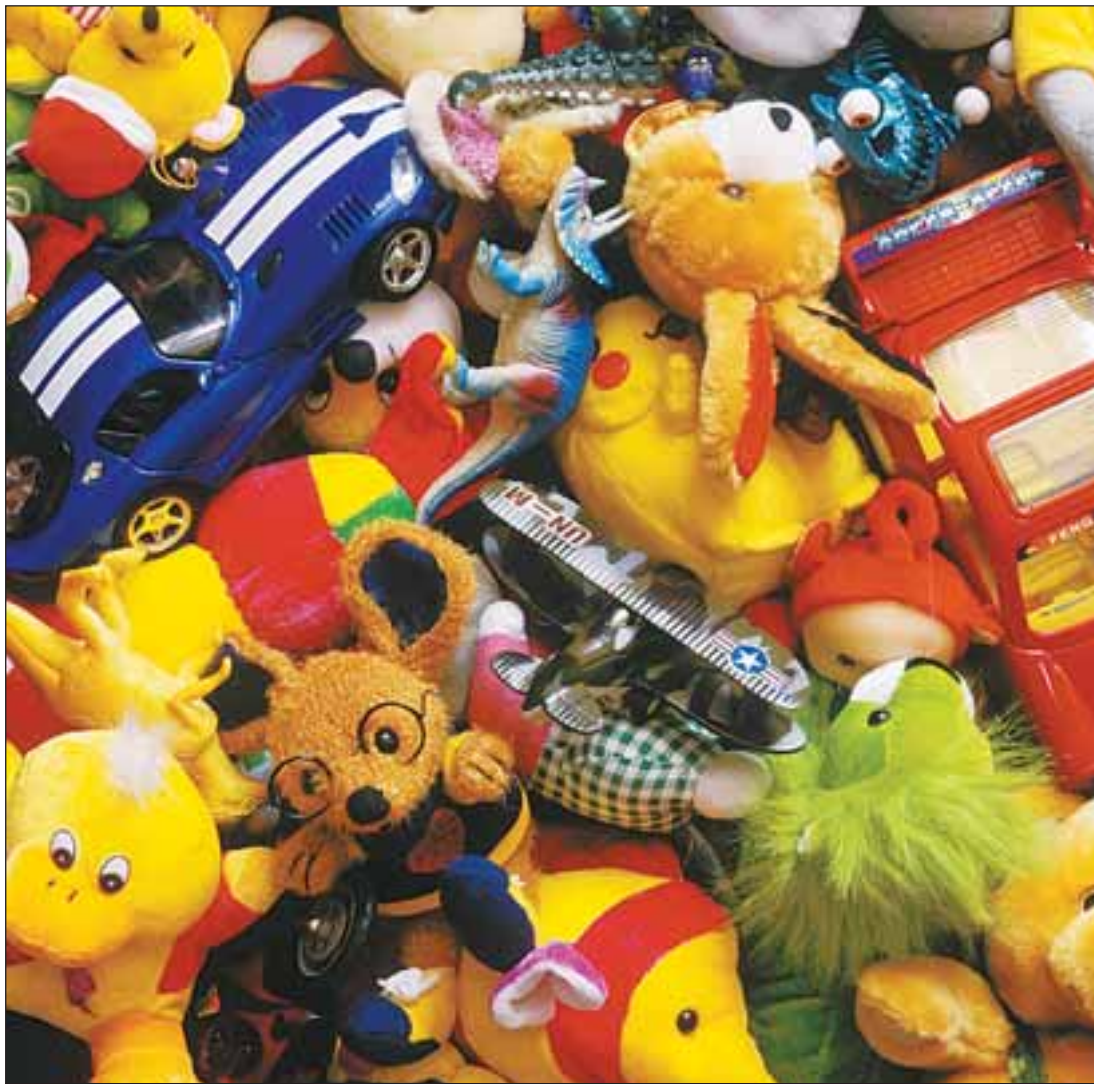
Привлекательные и опасные

ви для введення в обіг на споживчому ринку України продукції як імпортного, так і вітчизняного виробництва, без будь-якого контролю з боку держави, у т. ч. — для потенційно небезпечної недоброякісної продукції невідомого походження за демпінговими цінами.