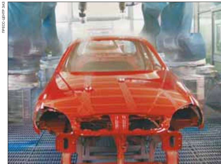
Цех покраски. Действуют роботы французской компании Sames