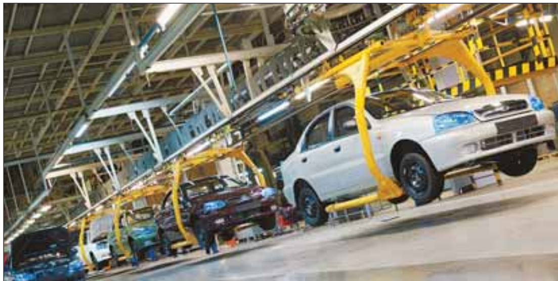
На конвейере каждый час собирают 30 автомобилей