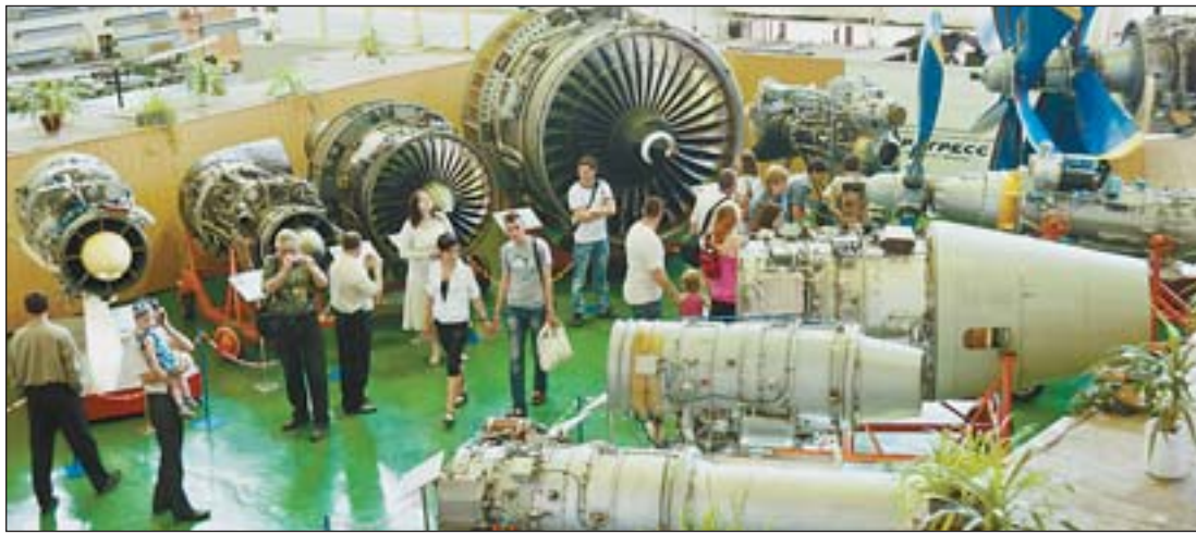
Газотурбинные двигатели авиационного и промышленного применения ГП «Запорожское машиностроительное конструкторское бюро «Прогресс» имени академика А.Г. Ивченко»

на создание рабочих мест и ликвидацию безработицы, недопущение снижения уровня жизни населения.