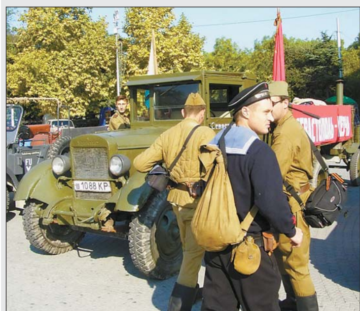
14 сентября состоялся автопробег ретротехники из Севастополя в Керчь, посвященный 38-й годовщине присвоения Керчи звания «Город-герой»

Против незаконного строительства автозаправочной станции на пересечении ул. Херсонская и Демина, неподалеку от жилых домов и поликлиники, выступили горожане. В знак протеста они перекрыли дорогу на перекрестке. Протест поддержали коммунисты. «Луганскому городскому головному мастерству управления ул. мэра Винницы Владимира Гройсмана», — такое мнение высказал народный депутат Украины, первый секретарь Луганского обкома КПУ Спиридон Килингаров. «Там мэр не позволяет себе наплеватьски относиться к решениям горсовета, — заявил коммунист. — Если власть решила, что рядом с поликлиникой и жилыми домами заправки быть не должно, — ее там не будет.