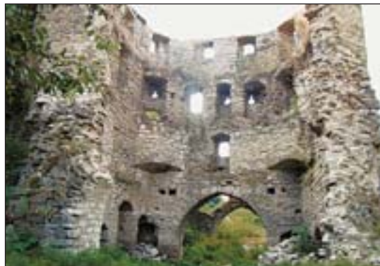
Новая Западная башня после обрушения (2011 г.)

Разрушением памятников у нас сегодня никого не удивит. Так, 2 августа обвалилась (уже не впервые) крыша на башне Золочевского замка на Львовщине. Новостройки смыкают кольцо вокруг Софии Киевской и Киево-Печерской лавры. «Евроремонт» харьковского Госпрома навсегда перечеркнул его перспективы на внесение в Список всемирного наследия ЮНЕСКО. В Западной Украине горят деревянные церкви. Памятники архитектуры «планово» разрушаются (нужны участки под новое строительство); их также снимают с учета как не соответствующие критериям, разработанным Госслужбой по вопросам национального культурного наследия (далее — Госслужба) при Минкультуры. Нависла угроза снятия охранного статуса с киевского Гостиного двора.