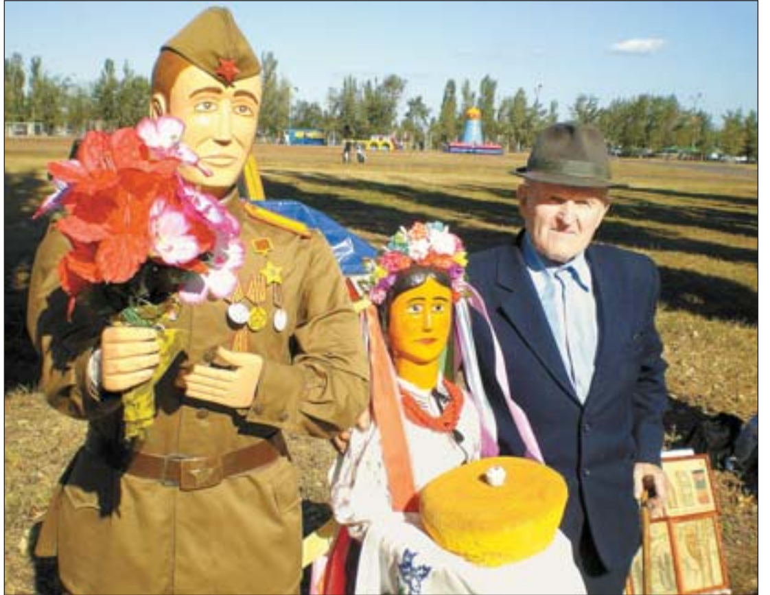
Михаил Волошин и его экспозиция