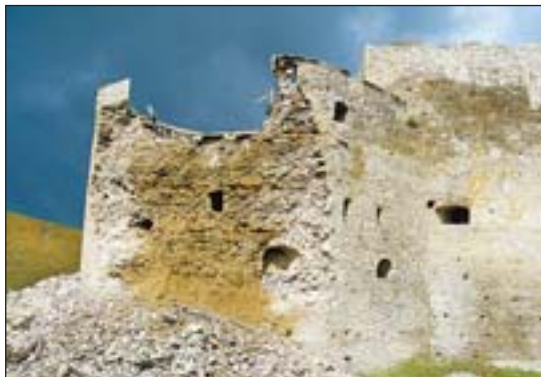
Главная башня комплекса Польских ворот сразу после обрушения (2009 г.)