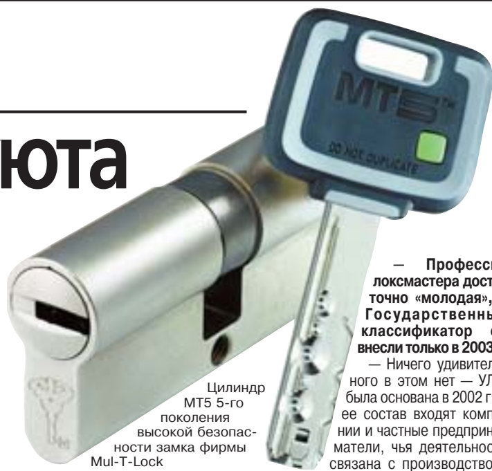
Цилиндр МТ5 5-го поколения высокой безопасности замка фирмы Mul-T-Lock

К изготовлению запасных ключей отнеситесь ответственно, ни в коем случае не соглашайтесь на предложение мастера прийти на следующий день. А что, если он передаст лишний дубликат квартирному вору? Выяснить, когда вы не бываете дома, сложности не представляет. Специалисту достаточно взглянуть на ключ, чтобы прочесть его код, а если у него квалификация недостаточная, то существуют станки-пантографы, с помощью которых без проблем можно скопировать самый сложный ключ. Мы считаем, что обслуживать запирающие системы должны надежные профессионалы, гарантирующие потребителю полную конфиден-