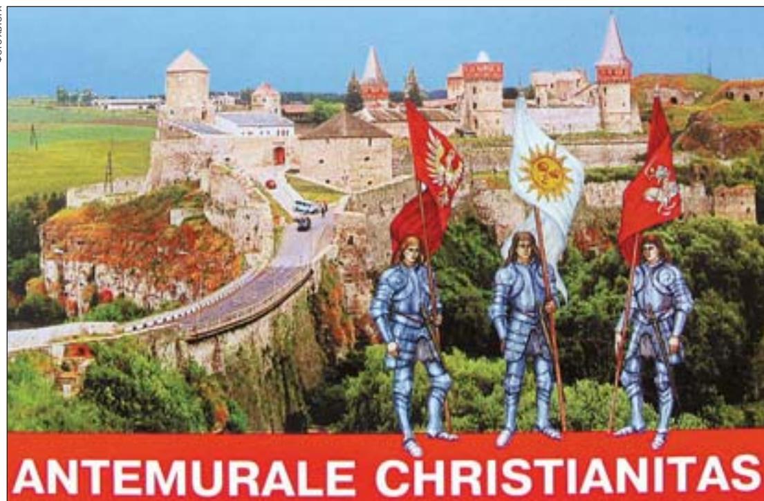
Старый замок на рекламной открытке

— Там происходит то же, что и по всей стране. В свое время НИИТИАГ разработал и утвердил научную концепцию и проекты регенерации заповедника. Предполагалось восстанавливать застройку на основе исторических материалов, лишь как исключение допускать щадящее новое строительство. Но в начале 2000-х, вразрез с принятыми решениями, в заповеднике началось масштабное новое строительство — с уничтожением культурного слоя и подземных остатков средневековых зданий на участках, отданных в аренду частным застройщикам. Госслужба согласовала