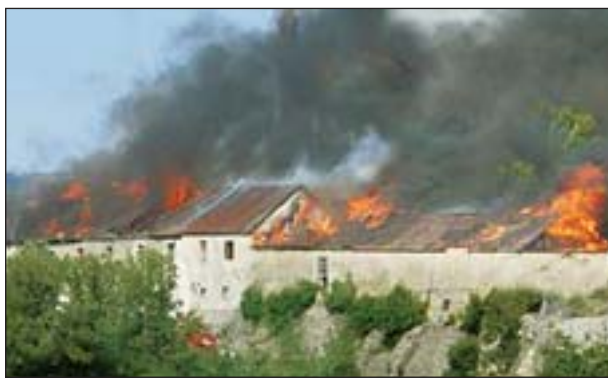
Пожар в монастыре доминиканок и его последствия

На территории Национального историко-архитектурного заповедника (НИАЗ) «Каменец» после ливней с сильными порывами ветра 1 августа разрушилась Новая Западная башня («Новой» ее называют с XVI в., когда здешняя крепость пополнилась несколькими башнями, в том числе и этой). Обвал вызвал лавину вопросов. Специально созданная комиссия начала выяснять ситуацию и причины случившегося. Мы решили взглянуть на проблему шире, так как она касается не только Каменца.