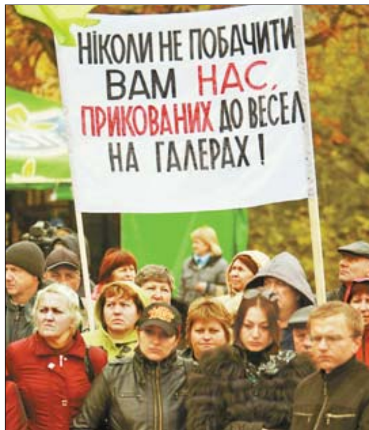
13 октября. «Марш пустых кошельков» у стен Верховной Рады, посвященный Международному дню борьбы с бедностью

И если даже во Франции, где уровень жизни трудового народа на порядок выше, чем в Украине, левые идеи овладели массами, левые партии получили большинство в сенате, то в нашей стране, в нашей ситуации левый поворот — это единственно возможный выход из либерального капиталистического тупика.