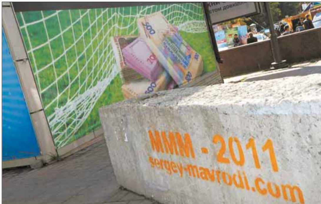
Реклама соблазняет на улице и в метро

Всемирный финансовый апокалипсис от Сергея Мавроди