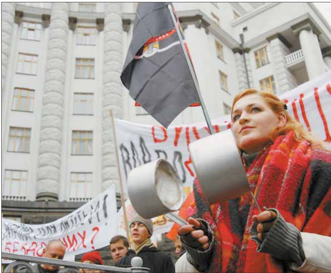
Киев, 15 октября. Марш бесквартирной молодежи прошел в рамках общеукраинской инициативы «Власть, строй обещанное!»