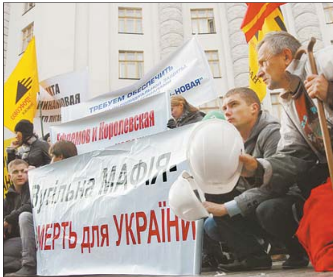
14 октября у здания Кабмина шахтеры Луганской обл. протестовали против произвола «угольной мафии». Незаконные действия органов государственной исполнительной власти и работодателей ГП «Луганскуголь», ГП «Свердловантрацит», ГП «Ровенкиантрацит», ООО «Краснодонуголь» направлены на уничтожение отрасли как госсектора промышленности, убеждены участники акции