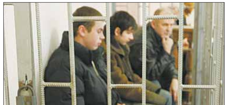
На скамье подсудимых