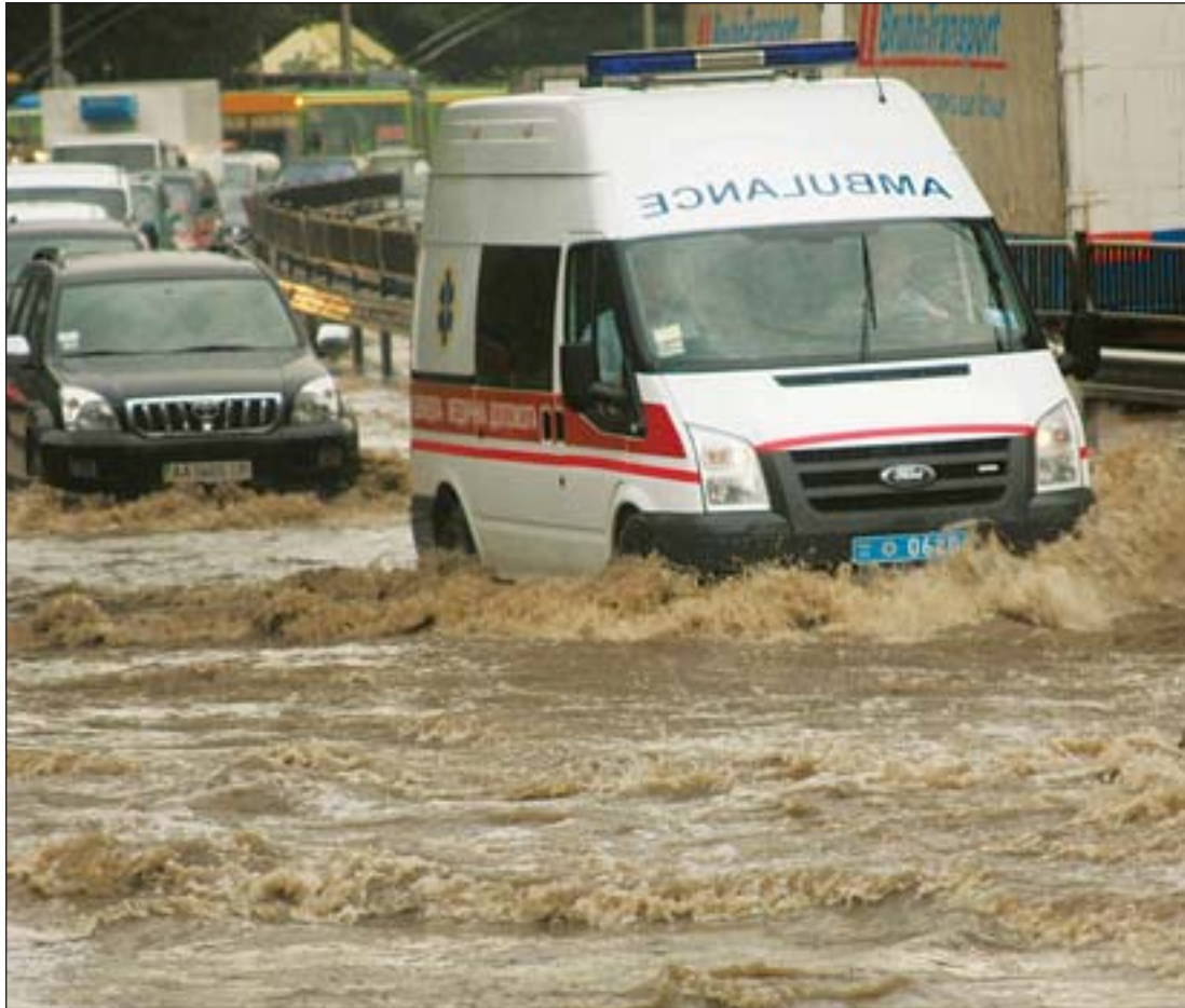
Ливневая канализация — одна из острых проблем столицы. А денег на ее ремонт по-прежнему не хватает

обработка осадков. Каждые сутки их образуется 12 тыс. куб. м. Технология же очень древняя: пройдя обработку, они перекачиваются на иловые поля с объемом около 3 млн. куб. м, но осадков закачано уже около 9 млн. куб. м. В этой связи одним из пунктов проекта реконструкции БСА рассматривается сооружение илосжигательного завода.