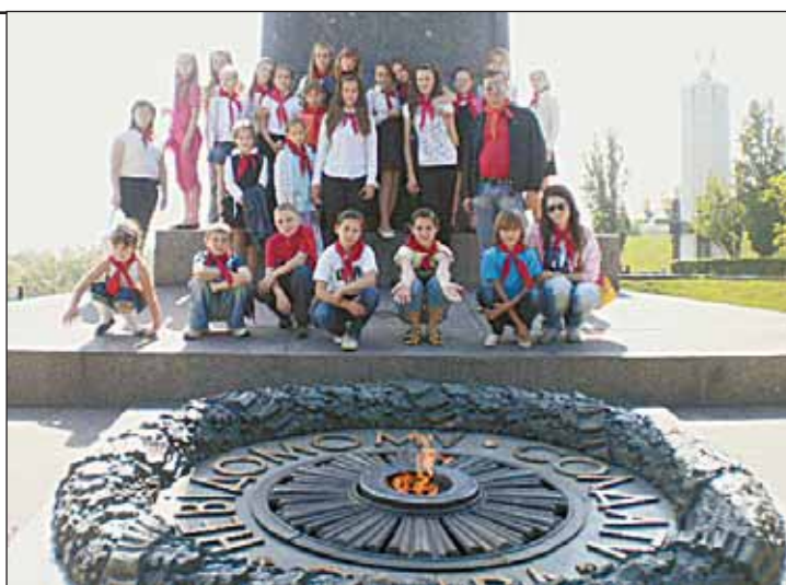
Новое поколение защитит от вандалов Вечный огонь

Вы только вдумайтесь: великая страна, победившая фашизм, через семь десятилетий присваивает фашистские названия улицам, а имена героев-мо-