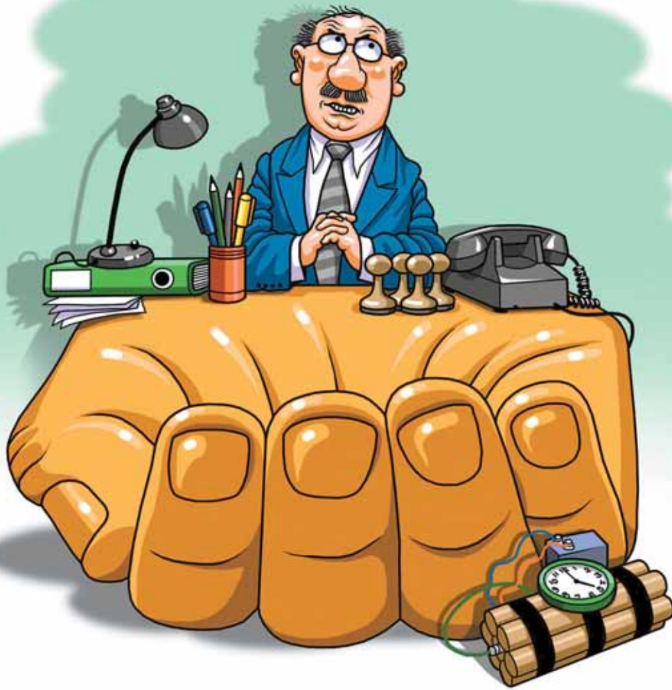
РИСУНОК ИГОРА КОМДЕНКО

нашествие земснарядов может привести к высыханию деснянской поймы, изменению русла реки, возможному затоплению населенных пунктов.