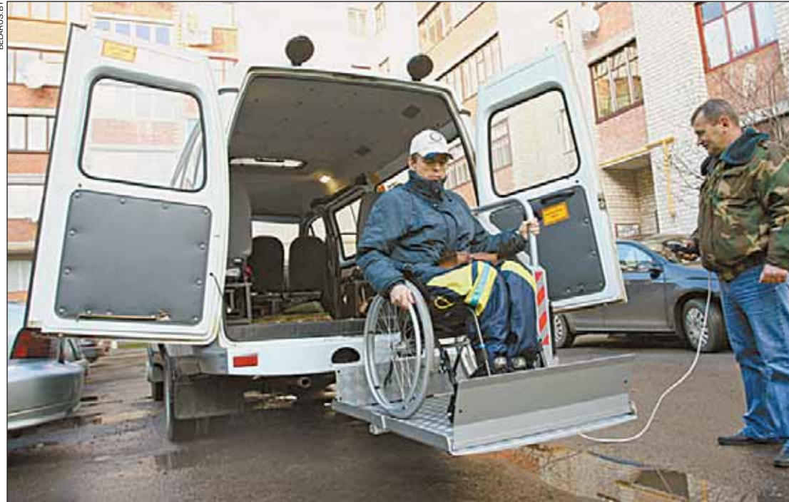
Социальный транспорт в Бресте