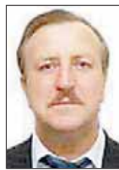
Андрей МЕДВЕДЕВ, первый секретарь Киевского ОК КПУ

Как только намечается новая избирательная кампания, олигархическая власть пытается искусственно разобщить народ, чтобы он, опомнившись, не проголосовал против всех «разноцветных» ставленников кланов. Технология известна: «разделяй и властвуй!»